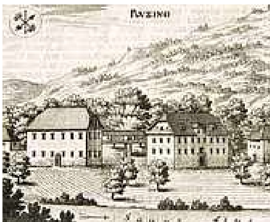
Valvazorjeva upodobitev Rocna (Mestni muzej Ljubljana)

Tekom stoletij je imelo rocensko gospostvo razne lastnike, med drugimi tudi Lamberge v 16. stoletju, Raspe v 17. stoletju, Schweigerje v 18. stoletju in Lazarinije v 19. stoletju. Najdlje so bili lastniki Schweigerji plemeniti Lerchenfeldi, kar 137 let, od 1671 do 1808.